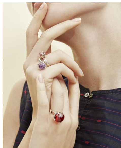
Infinie M - Collection Karoussel