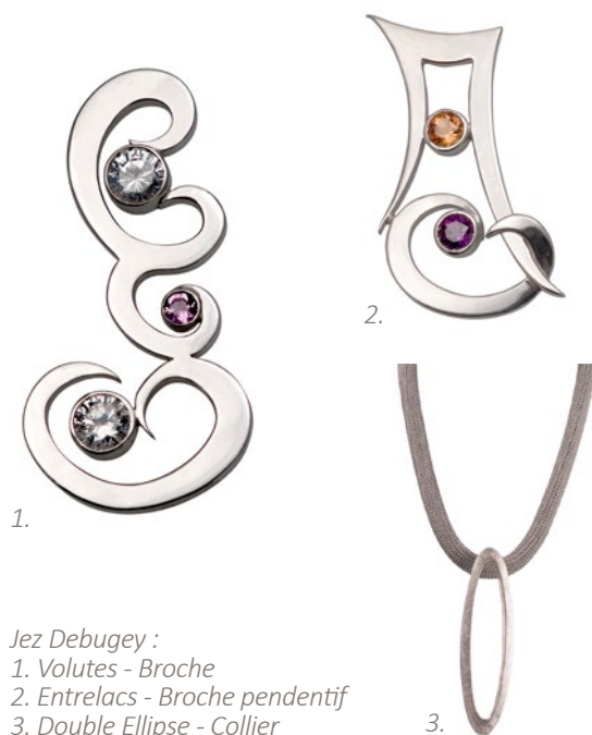
Jez Debugey : 1. Volutes - Broche 2. Entrelacs - Broche pendentif 3. Double Ellipse - Collier