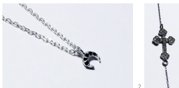
Les folies de Mélanie : 1. Collier Centauri - Argent et diamant noir 2. Collier Atria - Argent et diamant 3. Collier Céleste - Argent et diamant

Ses créations minimalistes et intemporelles sont de véritables bijoux de peau.