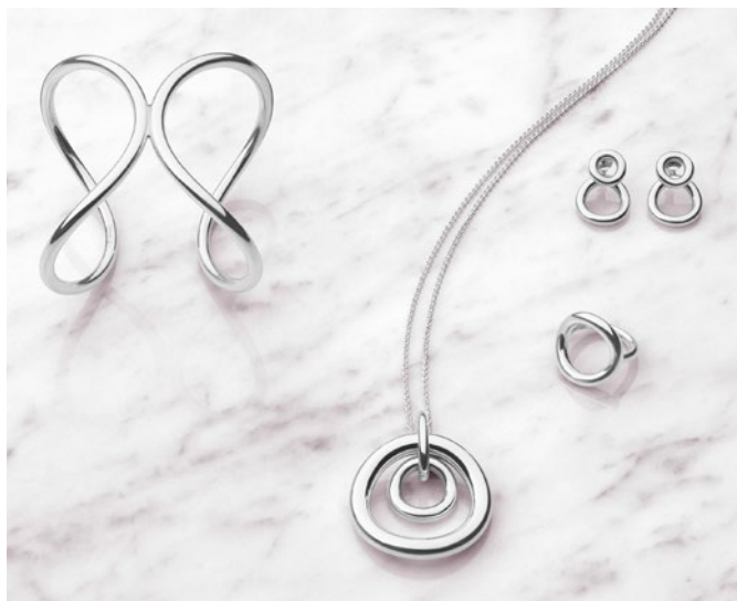
Christofle - Collection Idole