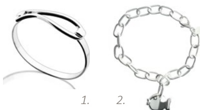
Clio Blue : 1. Jonc Les intemporels 2. Bracelet poisson 3. Ensemble de bracelets, joncs et manchettes

Depuis 2011, Clio Blue propose aussi des pièces dédiées à l'homme, « Lui de Clio », aux lignes chics et modernes.